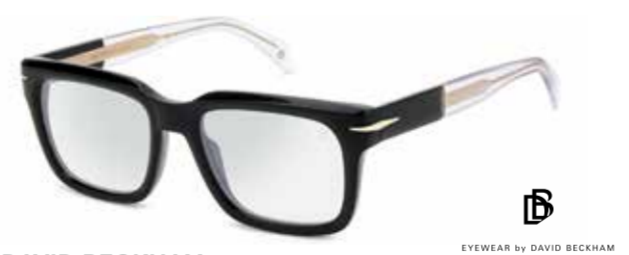
DAVID BECKHAM Die stilisierte Raute an den oberen Kanten und die Drahtkernkonstruktion an den Bügeln bezeugen David B.