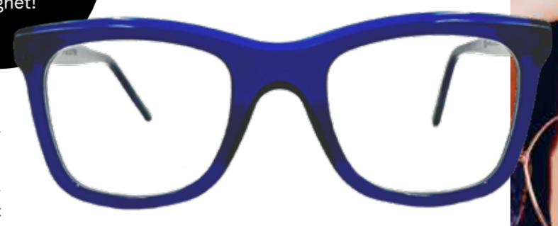
SPITTELBERG Füllige Ränder verkörpern reges Treiben, künstlerische Schöpferkraft sowie gemütliche Behaglichkeit.

Die Marke ist made in Austria, trotzdem im heimischen Markenvergleich preiswert. Jeder Kauf einer Scharfsinnfassung stärkt eigenständige, unabhängige Optikerbetriebe und belebt auch die heimische Wirtschaft.