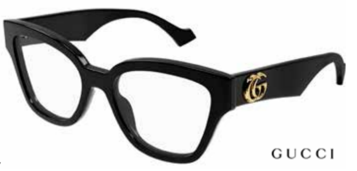
GUCCI Mit voller Wucht! Ein breites Bügeldesign demonstriert Selbstbewusstsein und verleiht pures Luxusgefühl.

Der Luxus legt eine andere Gangart ein. Selbstbestimmt, entschlossen und unbeeindruckt davon, was andere tragen. Markante Muster, Formen und Farben präsentieren sich auf dem gesamten Globus. Dabei formieren sich Frankreich und Italien als bedeutendste Knotenpunkte der Extravaganz.