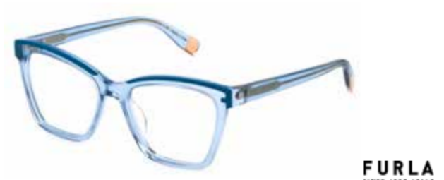
FURLA Ecken, Kanten sowie raffinierte Details an der Front führen einen unverwechselbaren Look vor Augen.