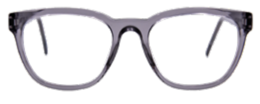
MUR Alles im Flow – der fließende Übergang in die ovale Form harmonisiert mit rundlichen wie eckigen Gesichtern.

KOSTENLOSER SEHTEST Wir bieten Ihnen einen kostenlosen Sehtest mit fachkundiger Beratung, damit Sie immer mit den richtigen Gläsern unterwegs sind. Unabhängig vom Sehtest sollte eine regelmäßige Überprüfung des allgemeinen Gesundheitszustandes der Augen bei einem Augenarzt erfolgen.