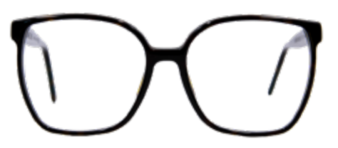
WÖRTHERSEE Volltreffer! Bühne frei für die 70er Jahre. Die weiten, quadratischen Rahmen passen perfekt zu jedem Retro-Look.