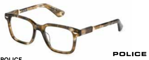
POLICE Buongiorno! Exklusives, marmoriertes Acetat trifft auf markante Proportionen in italienischem Flair.